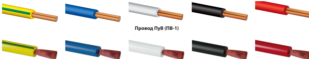
Провод ПуВ (ПВ-1)